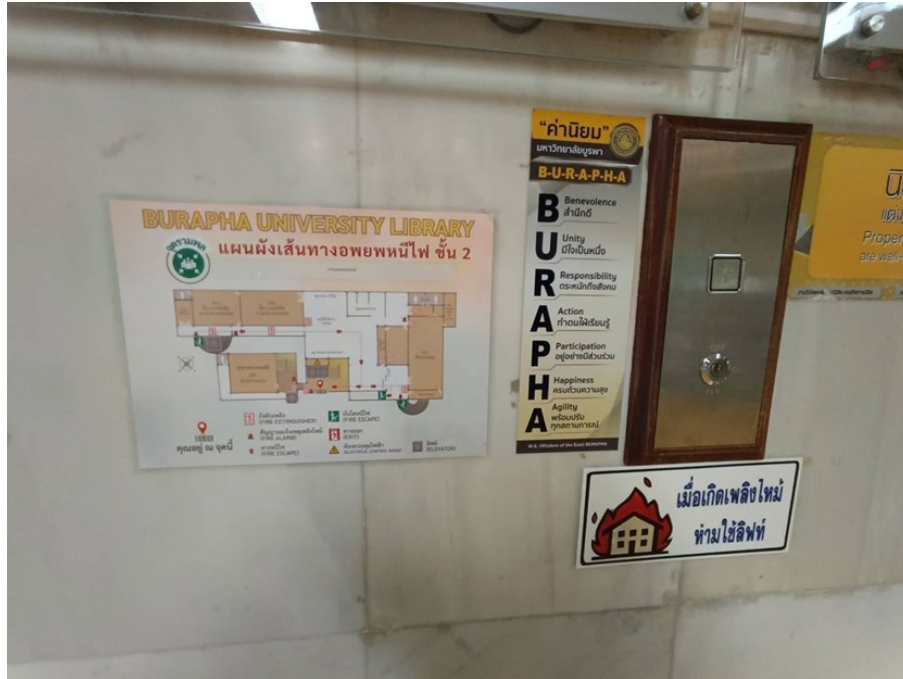
เส้นทางหนีไฟ

สำนักหอสมุดกำหนดเส้นทางหนีไฟ โดยจัดทำแผนผังเส้นทางหนีไฟติดที่บริเวณหน้าลิฟต์โดยสารแต่ละชั้น เพื่อสื่อสารให้ผู้ใช้บริการ บุคลากร รับรู้เส้นทางหนีไฟ และจัดทำป้ายบ่งชี้บอกทางหนีไฟไปยังจุดรวมพล ติดประจำทุกพื้นที่